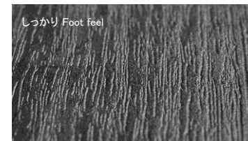
しっかり Foot feel ※ラシッサ フロアには、しっかりFoot feelを表現する樹種がないため、設定はありません。