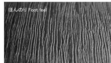
ほんのり Foot feel LL/クリエラスクF